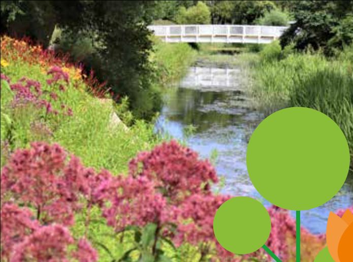
Brücke über die Nieplitz