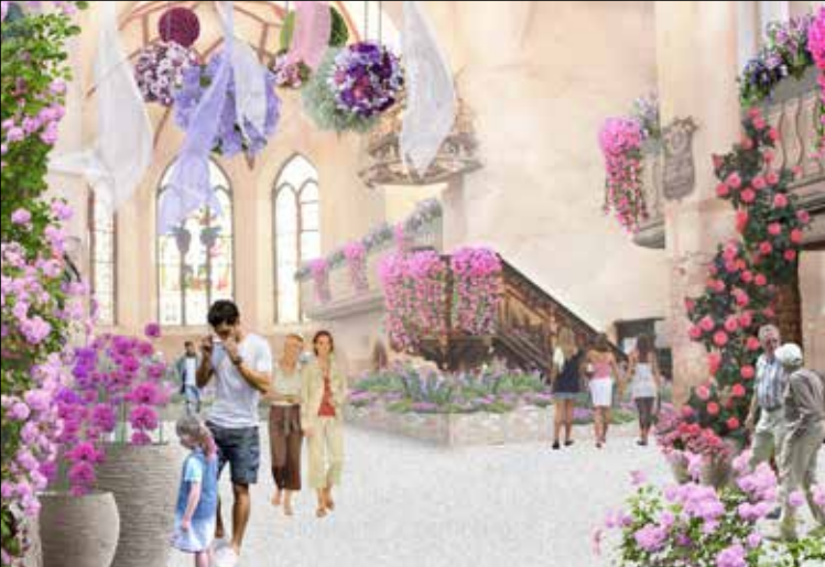
Stadtpfarrkirche St. Marien-St. Nikolai als Blumenhalle