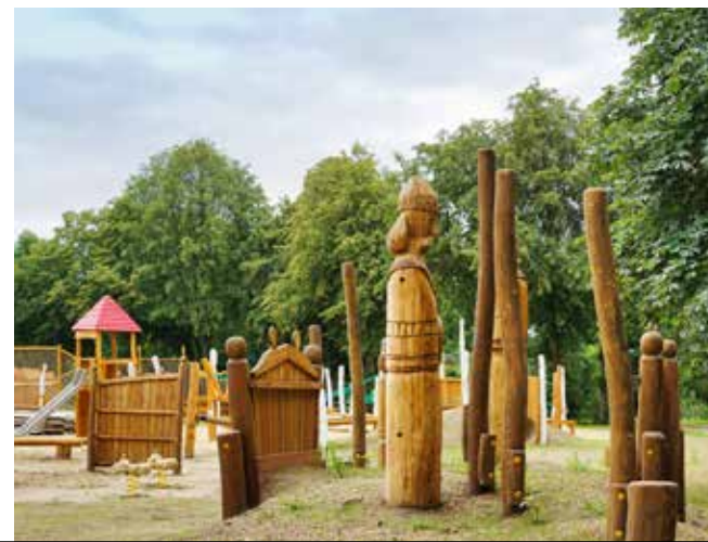
Abenteuerlandschaft für Kinder

Eingebunden in die Landesgartenschau werden die Altstadt mit der Pfarrkirche St. Marien – St. Nikolai und der Kirchplatz . Auch die Ortsteile der Stadt, Beelitz-Heilstätten sowie die Spargelhöfe in der Umgebung sind beteiligt und werden durch einen Bus-Shuttle mit dem Gartenschaugelände verbunden.